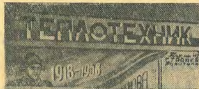
«Ничейный» орган печати.

ние своих органов партийные бюро должны поручать коммунистам, имеющим склонность к этой работе, а также комсомольцам, политически грамотным и авторитетным.